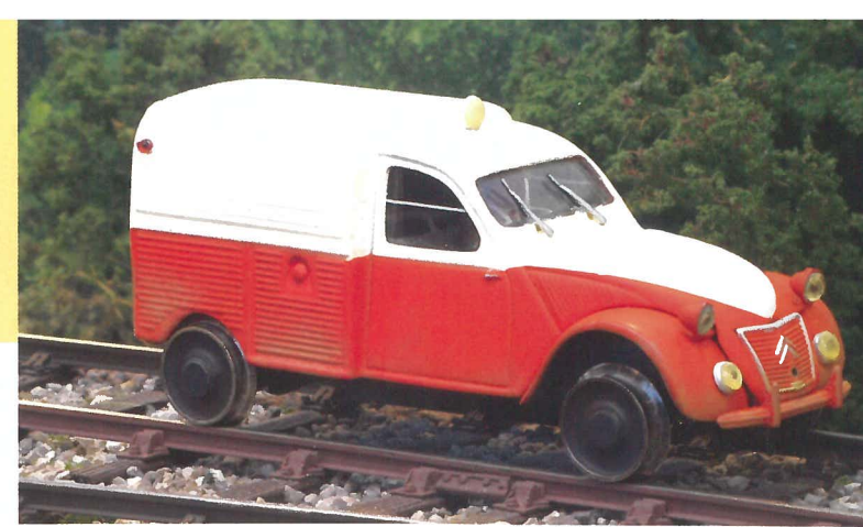
Cette draisine typique du Massif Central est une 2 CV Citroën Norev superdétaillée et motorisée.