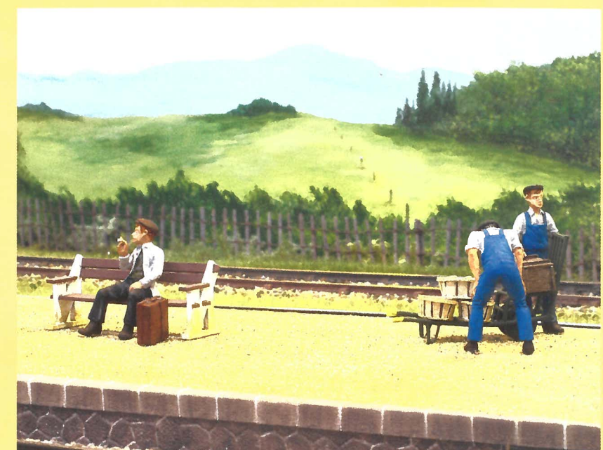
Sur le quai, dans l'attente d'un train...