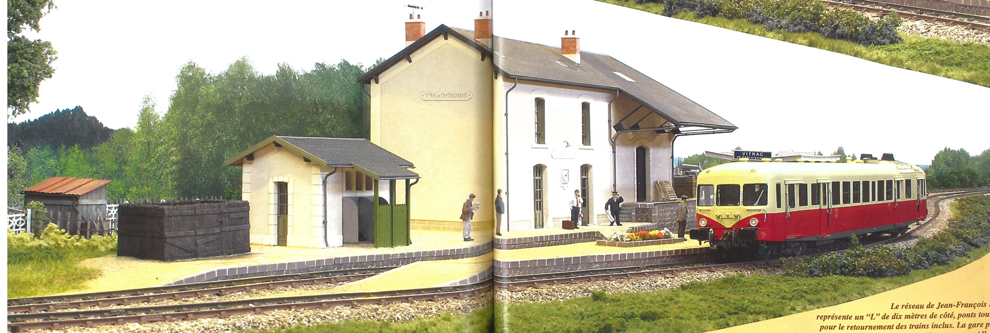
Le réseau de Jean-François L représente un "L" de dix mètres de côté, ponts tour pour le retournement des trains inclus. La gare po