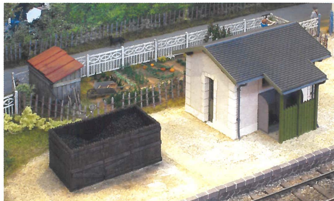
Les "lieux d'aisance" et le potager du chef de gare.