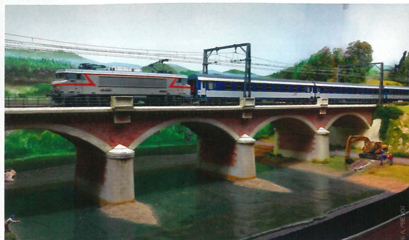
Le club limougeaud présentait une variante très classique du réseau HO destiné à mettre en valeur les trains : une simple section de pleine ligne de double voie