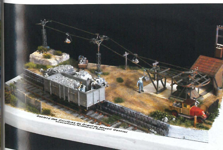
Prix « Coup de cœur-Loco-Revue »

Preiser ont été modifiés (posture et vêtements). Le wagon est un tombereau Midi REE. Celui-ci a été équipé d'attelages Weinert. Les portes ont été ouvertes pour représenter le chargement du wagon. »