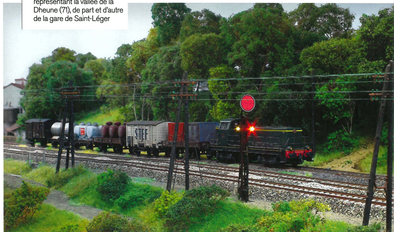
Le club de Chatenoy-le-Royal a largement développé sa section de ligne en HO représentant la vallée de la Dheune (71), de part et d'autre de la gare de Saint-Léger