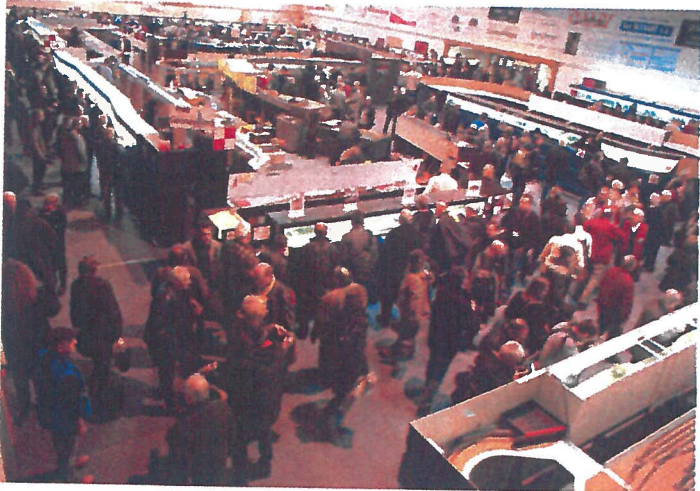
L'événement est toujours très attendu par les amateurs de modélisme.