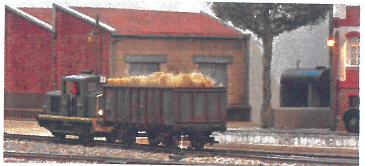
... priorité est donnée aux tableaux vivants.

Les 7 et 8 décembre, centre sportif Saint-Nicolas, RD 974, 21190 Meursault. Rens.: Agence de tourisme, 0380212590.