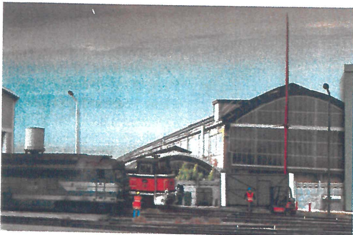
D'autres exemples de dioramas. Trains de voyageurs ou trains de fret...

Les 7 et 8 décembre, la ville de Meursault (Côte-d'Or) accueillera, la 5 e édition de la Fête du train au Pays des Grands Noms. Sur 3000 m 2 , la manifestation de modélisme réunira de nombreux exposants, répartis sur plusieurs quais thématiques: quai réseaux (dioramas, modules, clubs de modélisme), quai artisans (sociétés, entreprises), quai boursiers (vente de matériel neuf et de collection), quai culturel (librairies, exposition de peinture). Soit un véritable itinéraire pour le visiteur, invité à aller de découverte en découverte. Par ailleurs, un concours de modélisme (dioramas) sera organisé sur le thème «le poste d'aiguillage et son