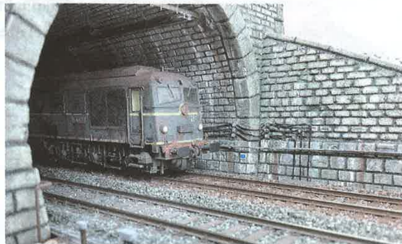
Réseau de F. Dubois - La Rampe d'Escalier

L'exposition s'articule autour de plusieurs "quais", véritables parcours thématiques qui vous guideront comme un itinéraire ferroviaire :